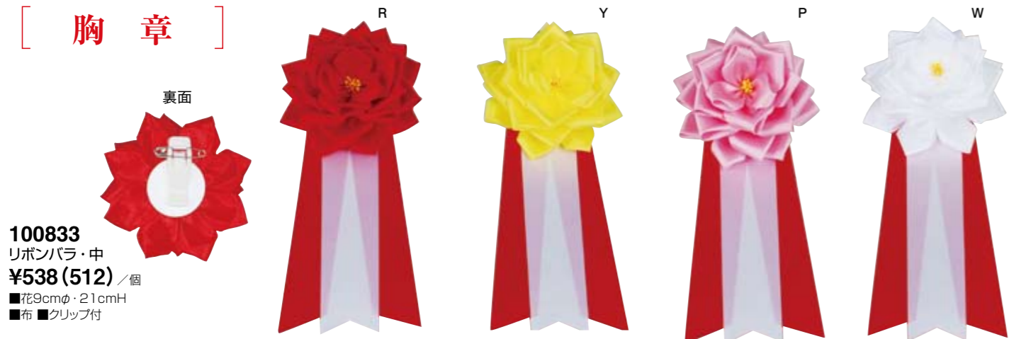
100833 リボンバラ・中 ¥538 (512) / 個 ■花9cmφ・21cmH ■布 ■クリップ付