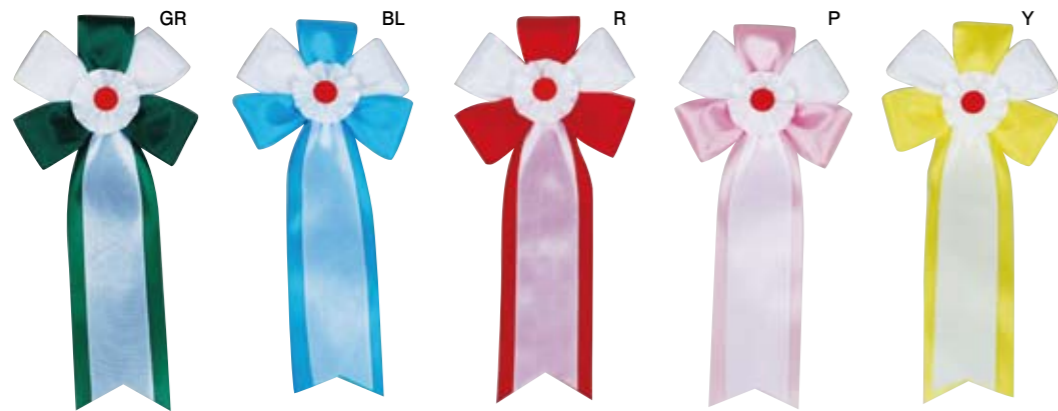
100854 中旭光 ¥141 (134) / 個 ■7cmW・16.5cmH ■布 ■安全ピン付